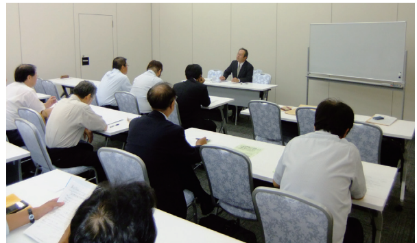
和智教授による講演

その後、第6会議室に場所を移して懇親会を行い、その後、場所を移して懇親会を行い、終始和やかな雰囲気での親睦を深めた。