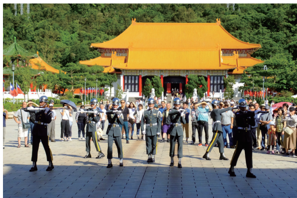
忠烈祠・衛兵交代式