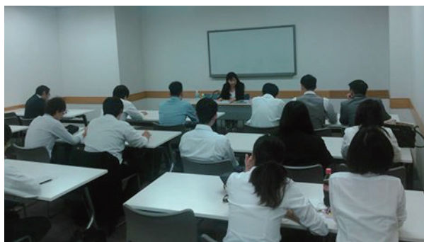
10月分科会講演風景