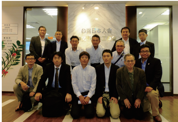
台北市日本工商会にて