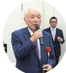
金究氏による乾杯