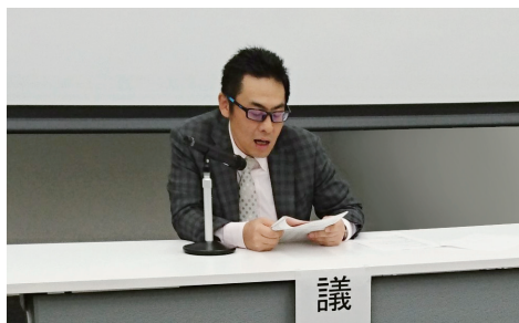
総会議長を務める菅原会長